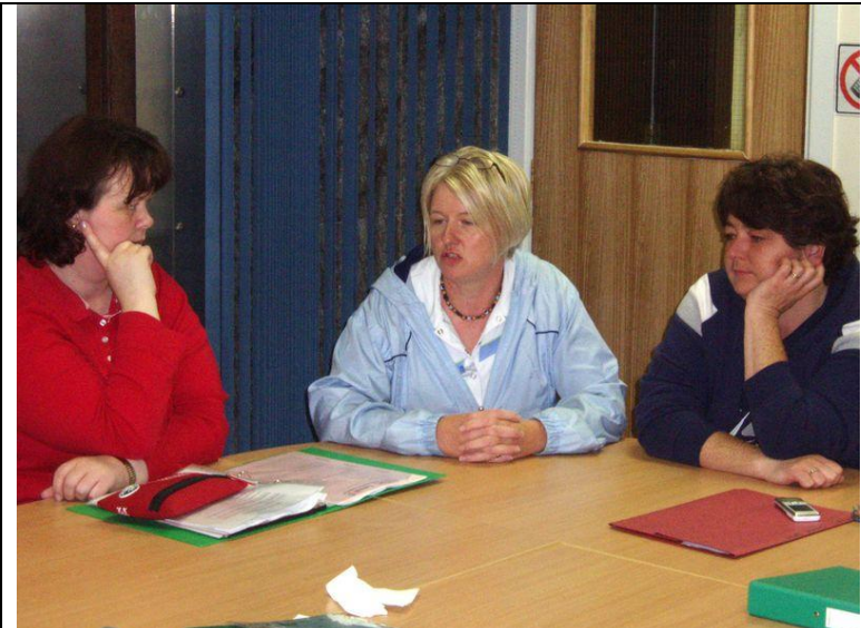
En irländsk ambassadör håller ett föredrag

Diskutera efteråt: Fanns det någon situation som du ogillade? Vilken situation var det? Varför då? Hur kändes det? Vilket kroppsspråk lade du märke till?