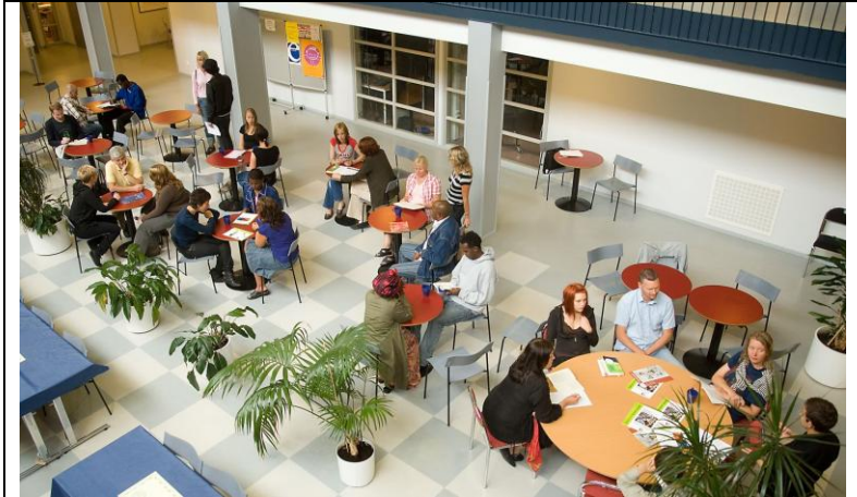
Elever i arbete (Sverige)

Eleverna får sedan diskutera för- och nackdelar med ovanstående.