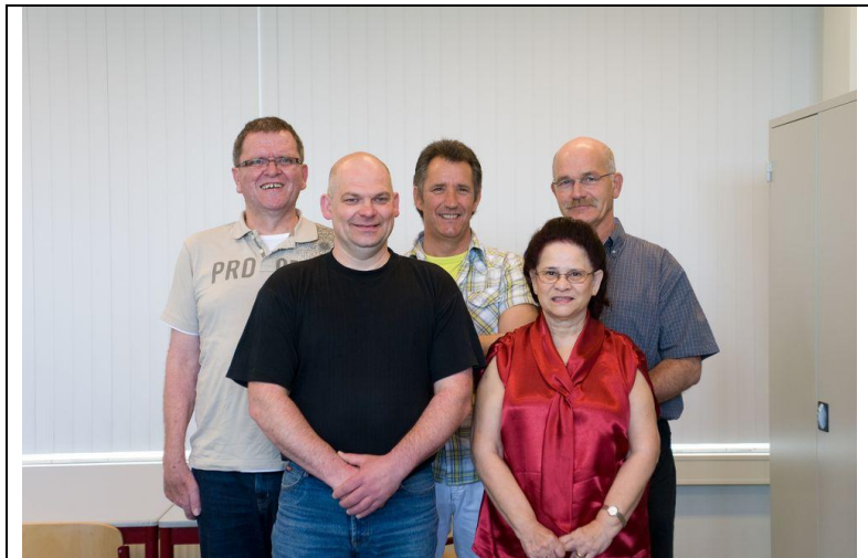
Några ambassadörer på ROC Nijmegen (Nederländerna)

När en ambassadör når en punkt då han eller hon är säker och fylld av självförtroende kan man klara av att fungera som mentor för nya elever. Här nedan har vi listat några aktiviteter som en mentor kan genomföra.