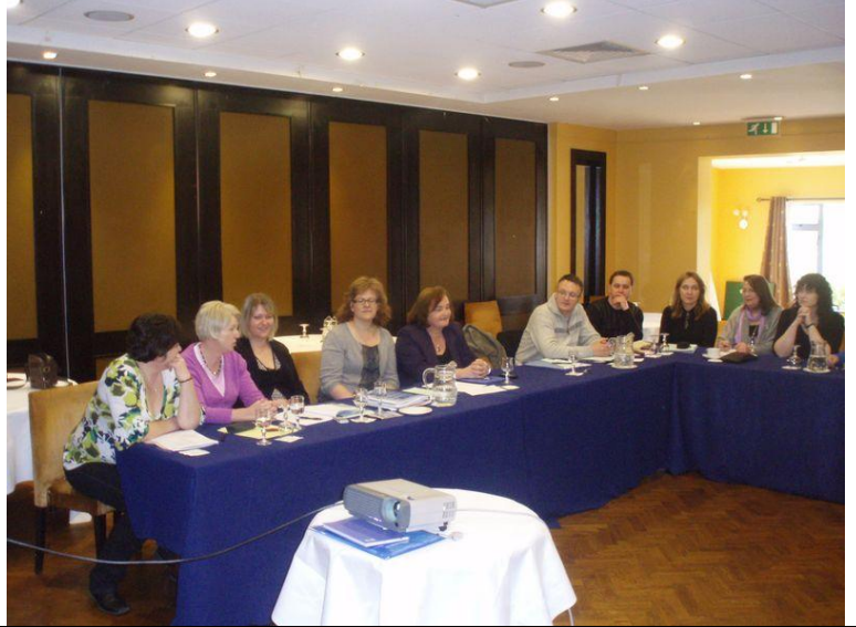
Tre irländska ambassadörer (till vänster) med deltagarna vid det tredje projektmötet

Ambassadörsmodellen gör trots allt mer än att bara locka och motivera eleverna att fortsätta studera. I och med att modellen har utvecklats har det snabbt blivit tydligt att den även är ett användbart undervisningsverktyg i ett brett spektrum av olika färdigheter. Organisationer