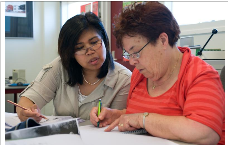
En elev hjälper en annan elev (Nederländerna)

Två elever: A och B. A är någon som har gjort ett visst jobb. B är någon som knappt vet något alls om det här jobbet. A och B sitter framför gruppen och de andra eleverna iakttar dem. På ungefär tio