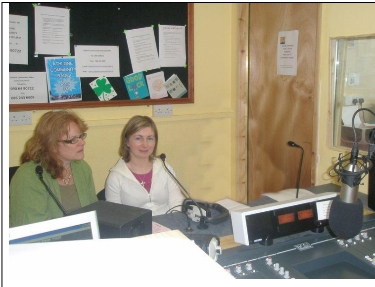
En radiointervju (Irland)

Att man blir intervjuad i media händer inte så ofta, men det är ett väldigt bra sätt att marknadsföra sig. Litauiska ambassadörer fick möjligheten att berätta om sina liv och sin utbildning i tidningar, och irländska och holländska ambassadörer gjorde intervjuer i radio och TV. Då utforskas de olika färdigheter som krävs för olika intervjuformat. Eleverna förbereder sina tal innan de spelas in och de skriver ner sina repliker i förväg för att det ska bli en bra inspelning.