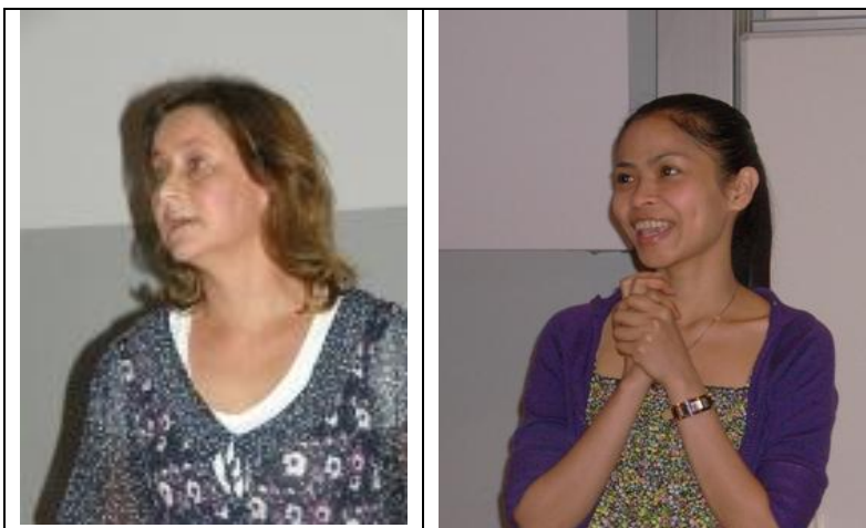
Två svenska ambassadörer berättar om sina liv för arbetslösa ungdomar

Övningen gick ut på att filma ambassadörerna när de berättade om sina liv. Filmerna är tänkta att inspirera andra vuxna att börja studera. Ett annat syfte med övningen är att ambassadörerna får framträda inför publik.