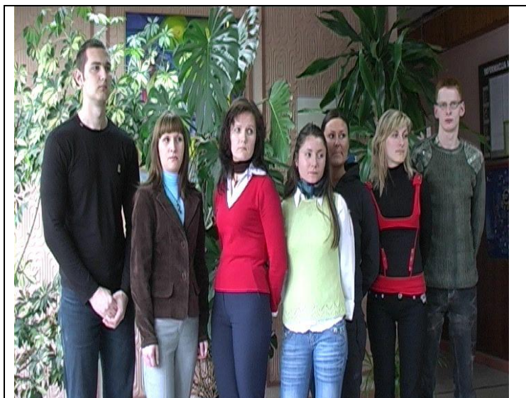
Ambassadörer från Jonava Adult Education Centre (Litauen)

I vissa fall kan elever som inte uppfyller alla krav ändå väljas ut. Till exempel kan elever med ganska enkla kommunikationskunskaper vara väldigt övertygande om de kan berätta om sina spännande livserfarenheter och påvisa positiva förändringar i sina liv.