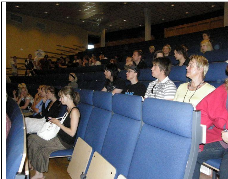
Konferens för arbetslösa ungdomar där två av CFL:s ambassadörer deltog (Sverige)

Be en grupp elever söka fram berömda tal – t.ex. av Martin Luther King, Nelson Mandela, Barack Obama o.s.v. Analysera och definiera på vilket sätt de är effektiva och övertygande. Visa filmer med politiker för att visa kroppsspråket. Be eleverna att hålla en del av det tal som de har letat fram. Spela in dem på film (när de känner att de trivs i en mindre grupp) för att de ska vänja sig vid att filmas och för att kunna gå igenom deras färdigheter.