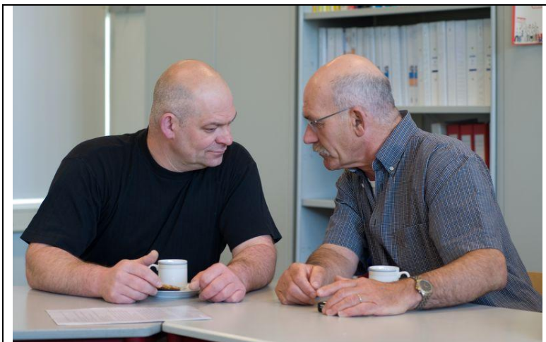
Två holländska ambassadörer talar om sina erfarenheter som ambassadör

Ambassadörsmodellen är ett effektivt verktyg för att rekrytera och motivera vuxna elever på många områden och nivåer inom vuxenutbildningen. Vare sig deltagarnivån och intresset är lågt eller högt för vuxenutbildning i ert land är ambassadörsmodellen ett användbart verktyg för att locka elever som är svåra att nå. Det kan även motivera elever att fortsätta studera och gå vidare till högre utbildning. Det kan skapa kontakt med andra organisationer och hjälpa ert lärcenter att knyta an till samhället i stort.